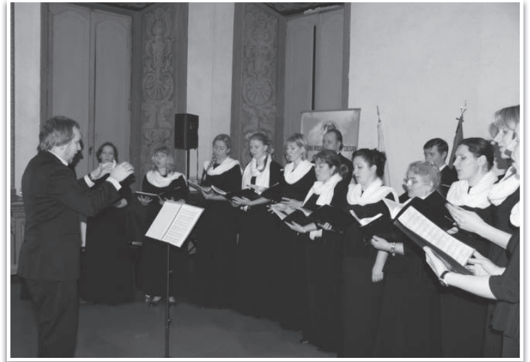
Во время концерта в Риме.

Православными хорами была совершена экскурсия в город Манопелло, где хра-