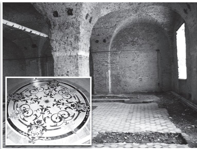
Так выглядит сегодня новый рисунок напольного покрытия в притворе Троицкого собора. Справа – напольное покрытие собора, откопавшееся реставраторам в 2009 году.