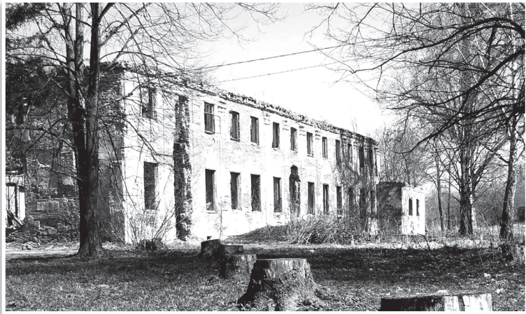
Главный дом Демьяновской усадьбы посещала императрица Екатерина Вторая, а ко входу вела аллея вековых деревьев.