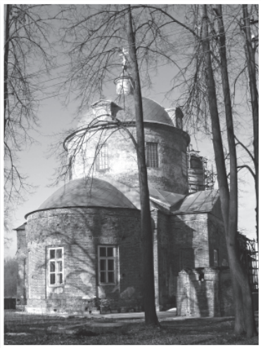
Казанский храм в Кленкове.