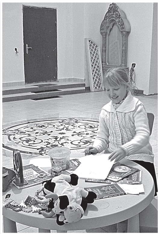
В просторном притворе Троицкого собора, конечно же, нашлось место для такого вот приятного уголка.

Наша газета уже писала о том интересном инженерном решении, по которому был устроен обогрев собора в 19 веке. Кратко «нарисуем»