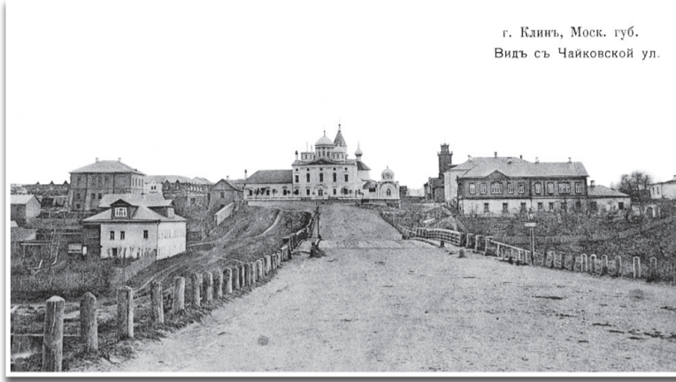
г. Клинь, Моск. губ. Видь с Чайковской ул.

XIX век. На этой архивной фотографии отчетливо видно, что слева на купольных барабанах Троицкого собора пока отсутствуют два купола.