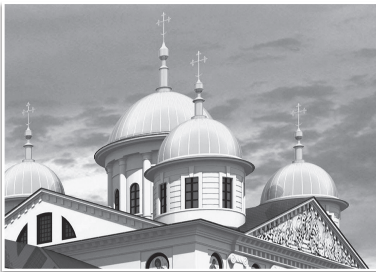
Вот так, по мысли реставраторов, будут выглядеть купола на главном храме нашего города - Троицком соборе.

После того, как пала последняя кирпичная колонна парадного входа в дом культуры «Пульс» («перестал биться пульс безбожной власти», как сказала одна молодая клинчанка) и стараниями строителей «слетел» слой наружной штукатурки с уличного фасада, — так сразу в городе заговорили о внешней неприглядности здания. Но тут уж ничего не поделаешь: реставрация есть реставрация, и красный наружный кирпич выполняет свою еще одну важную функцию: он «сигнализирует» о состоянии несущих конструкций.