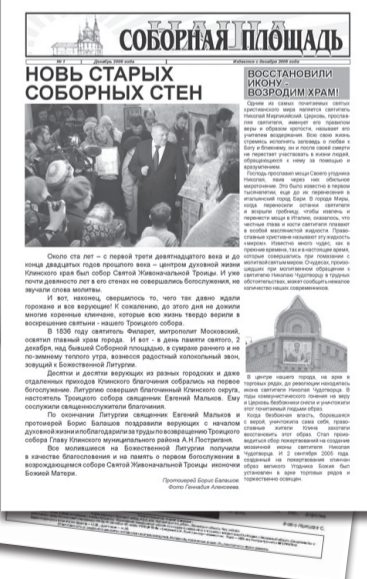
Первый номер газеты «Наша Соборная Площадь». Декабрь 2008 г.

Дело оказалось вот в чем. Что мы понимаем под восстановлением Троицкого собора? Если только то, чтобы вернуть городу лишь прежний вид храмового здания, воссоздать его прежний внешний облик и внутреннее убранство — то да,